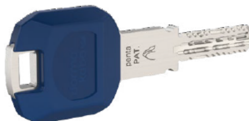
Schlüssel mit Largekey-Clip