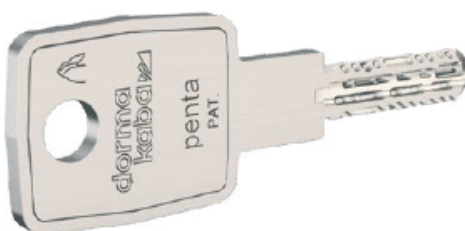
Schlüssel mit langer Reide aus Neusilber